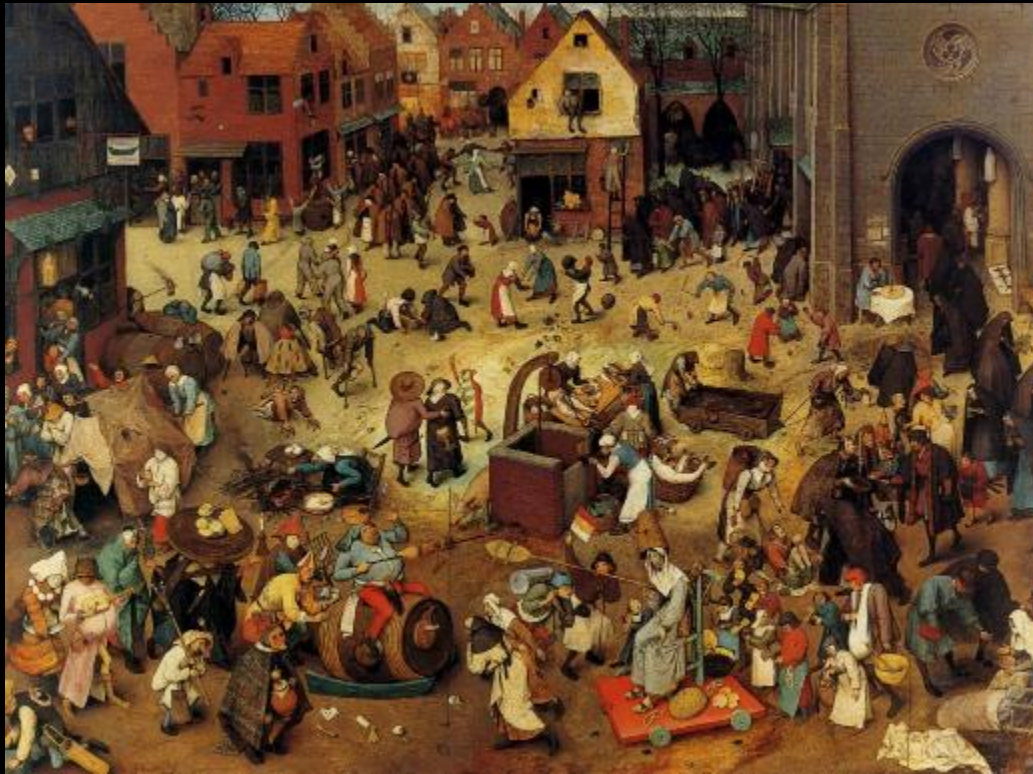
Pieter Bruegel de Oude, 'Strijd tussen Carnaval en de Vasten'. Olieverf op paneel. 1559

Deze drie vrijblijvende benaderingen van werk van Bosch, Bruegel de Oude en Camus, die elk op hun manier de menselijkheid van het leven en de verbeelding loven, delen het radicaal optimisme van WHAT DO YOU MEAN WHAT DO YOU MEAN AND OTHER PLEASANTRIES. De vormelijkheid van de 'grillen' van Bosch, het nederig beleven van de vergankelijkheid bij Bruegel en Camus' besef van de zinloosheid van het bestaan om daar dan weer passioneel mee om te gaan, kleuren deze voorstelling tot het ultieme feest van het bestaan.