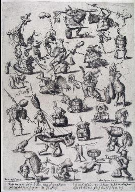
Anoniem (naar Jheronimus Bosch). 'Ieronimus bosch drollen'. Gravure. 16 de eeuw.

Dese Ieronimus bosch drollen, lang ghepropheteert Siet, hoe elck sijnen strijt hier den sin, gheeft Soo ongheschickt, nu oock tweerelts strijt verabuijseert, alsoo dat elck vat, gheeft wt, sulcks hij in, heeft.