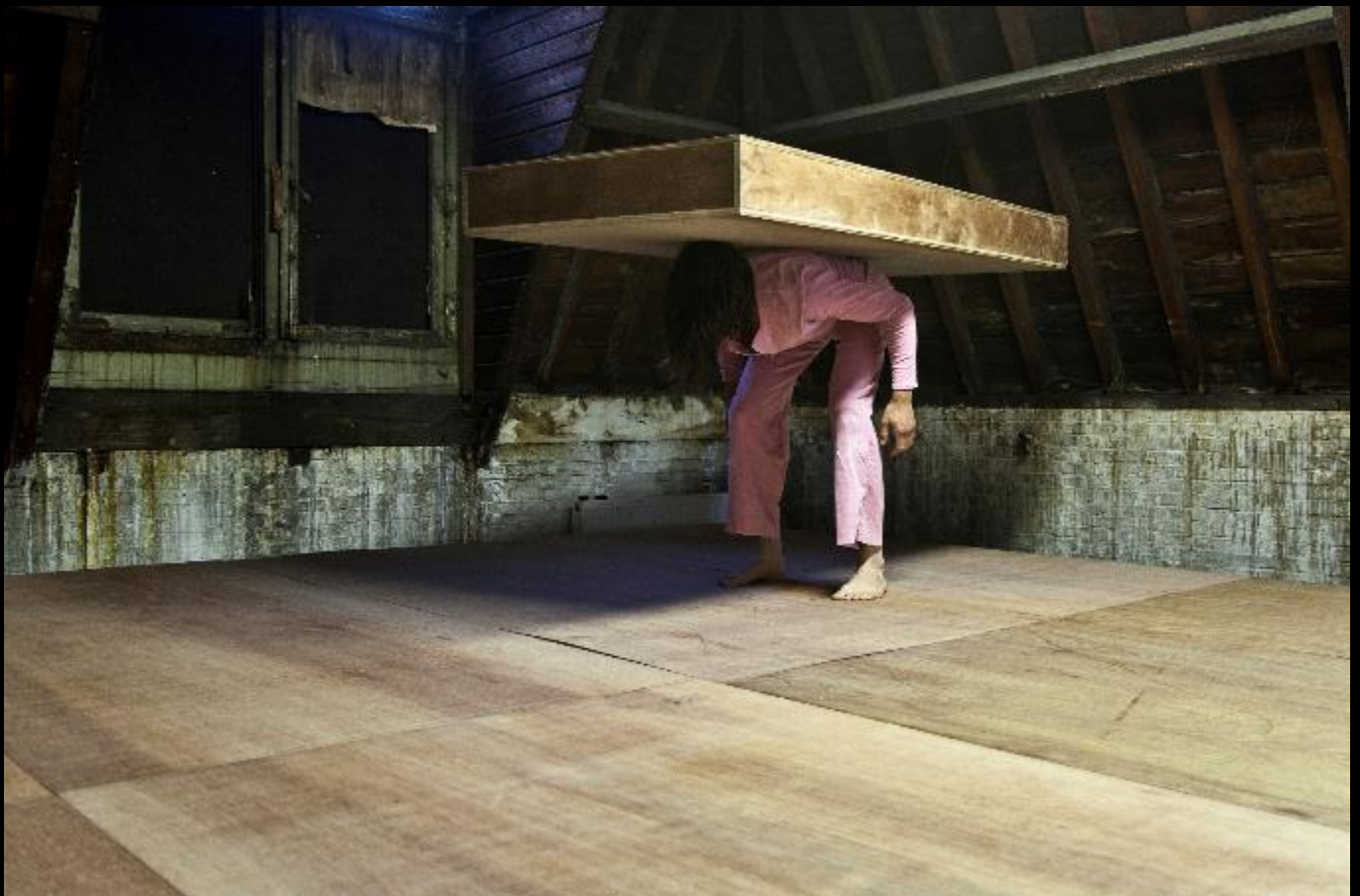
Oninteressant Resultaat, Maarten Seghers, © Anu Vahtra, 2011