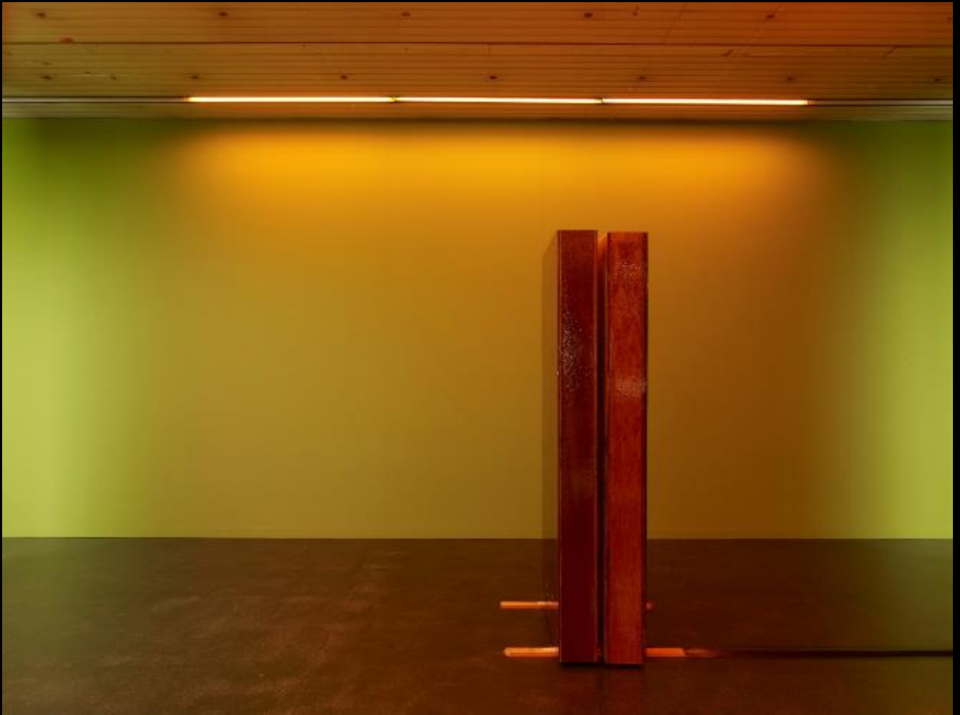
Fontein (Laat-Pornografisch Evenwicht) II, Maarten Seghers | bkSM #10, 2010