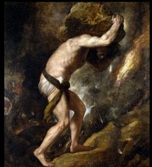
Titiaan, 'Sisyphus'. Olie op doek. 1548-1549.

Tough Shit spiegelt zich aan een personage uit Pieter Bruegel de Oude's 'Strijd tussen Carnaval en de Vasten' waarin een humaan, onbehaaglijk beeld van het alledaagse leven geschilderd wordt: een kreupele man die zonet kleine houten speelgoedpaardjes zonder kop in de handen geduwd heeft gekregen om zich mee voort te trekken, schuurt zijn borst over de onverharde en rioleringsloze dorpsbaantjes, om het niet met zijn nagels te moeten doen. Tough Shit omarmt dit absurd volhardende van Bruegels personages, en vindt zijn gelijke ook terug in Sisyphus van Albert Camus. Sisyphus – die als de sterveling in opstand kwam tegen de goden en daarvoor de meest ernstige straf denkbaar opgelegd kreeg: zinloosheid – werd gedoemd eeuwig een rots de berg op te duwen, te kijken hoe deze weer naar beneden rolt en opnieuw te beginnen. Sisyphus als de ultieme absurde held. "We moeten ons Sisyphus als een gelukkig mens voorstellen", schrijft Camus.