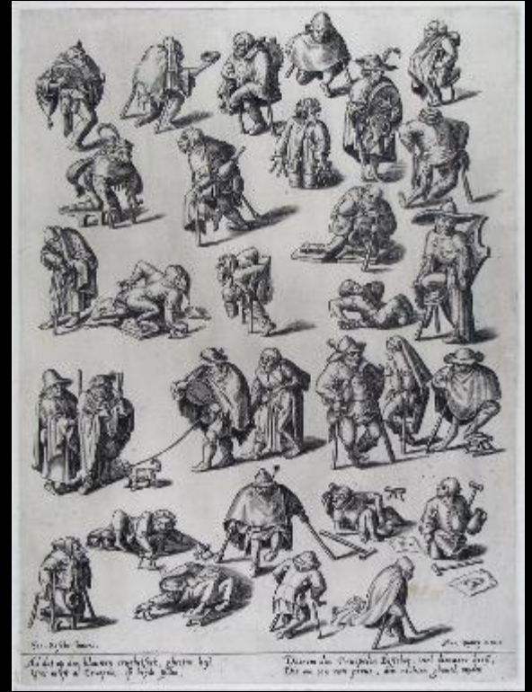
Anoniem (naar Jheronimus Bosch of Pieter Bruegel de Oude). 'Bedelaars en kreupelen'. Gravure. 1550-1600.

Dese Ieronimus bosch drollen, lang ghepropheteert Siet, hoe elck sijnen strijt hier den sin, gheeft Soo ongheschickt, nu oock tweerelts strijt verabuijseert, alsoo dat elck vat, gheeft wt, sulcks hij in, heeft.